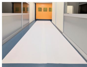
構内の通路 / 廊下の汚れ防止に