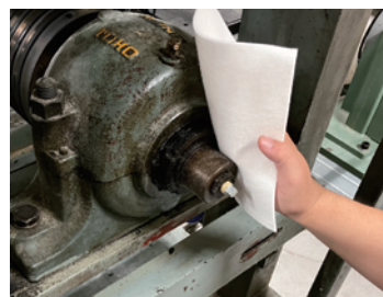
厚手のワイピングクロスに