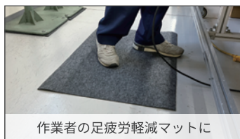
作業者の足疲労軽減マットに