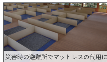
災害時の避難所でマットレスの代用に