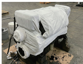
機械 / 製品の緩衝材または梱包材に