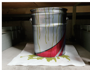
油を纏った製品の下敷きマットに