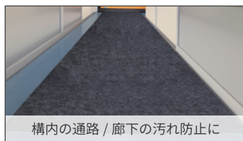
構内の通路 / 廊下の汚れ防止に